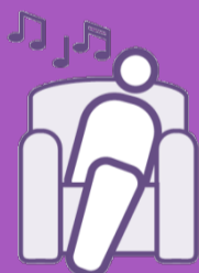
Entspanne dich bewusst