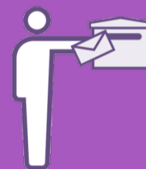
Halte Kontakt mit Freunden