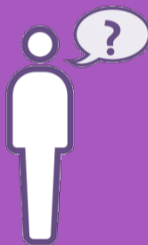
Hol dir Hilfe